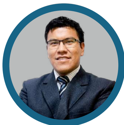
Primer consejero Carlos Dávila